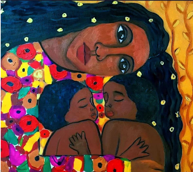
Obra Refugiados (2021) da artista Palestina Malak Mattar, nascida na Faixa de Gaza.